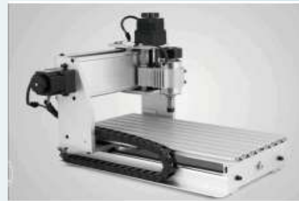
CNC laserska gravirka